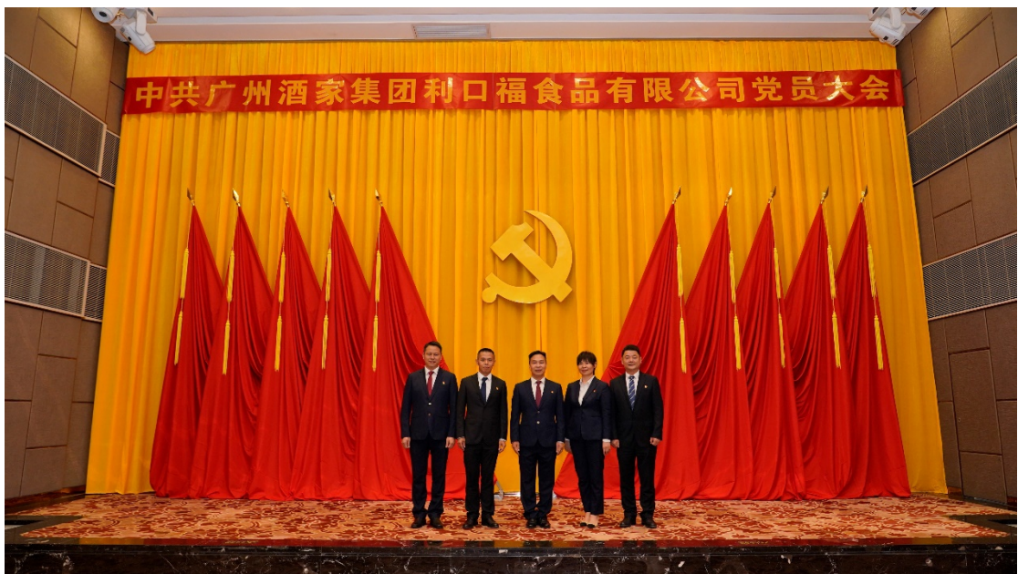
中共广州酒家集团利口福食品有限公司委员会委员