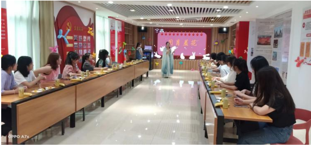
(利口福公司工会举办“粤菜师傅—广州酒家班”贵州毕节实习生“迎国庆·贺中秋”活动)