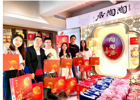
(下属各公司工会慰问困难职工，并为一线岗位职工送上慰问品及清凉饮料)