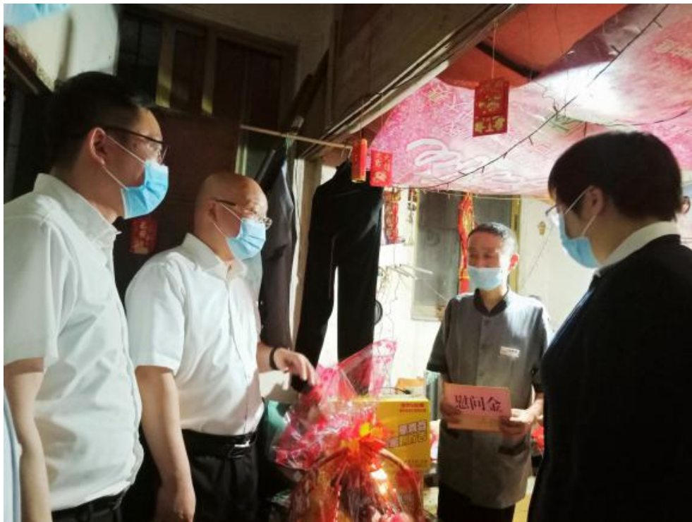
(集团领导带队走访餐管公司、百福公司困难职工)