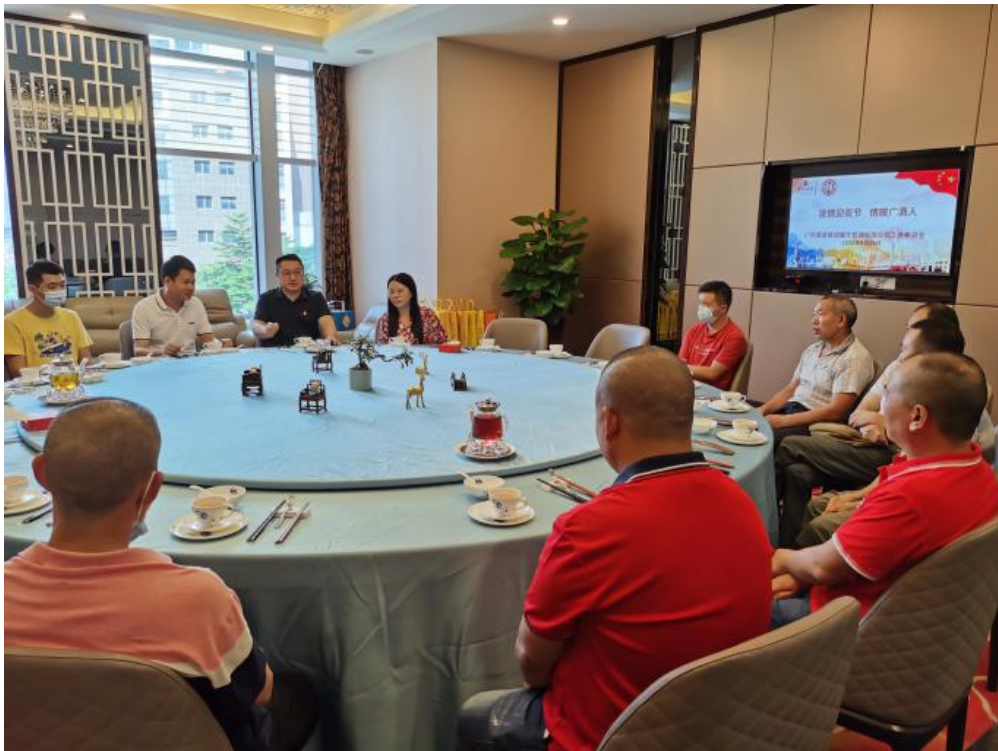
(餐管公司工会开展“浓情迎双节，情暖广酒人”——贵州籍来穗务工人员中秋慰问座谈会)