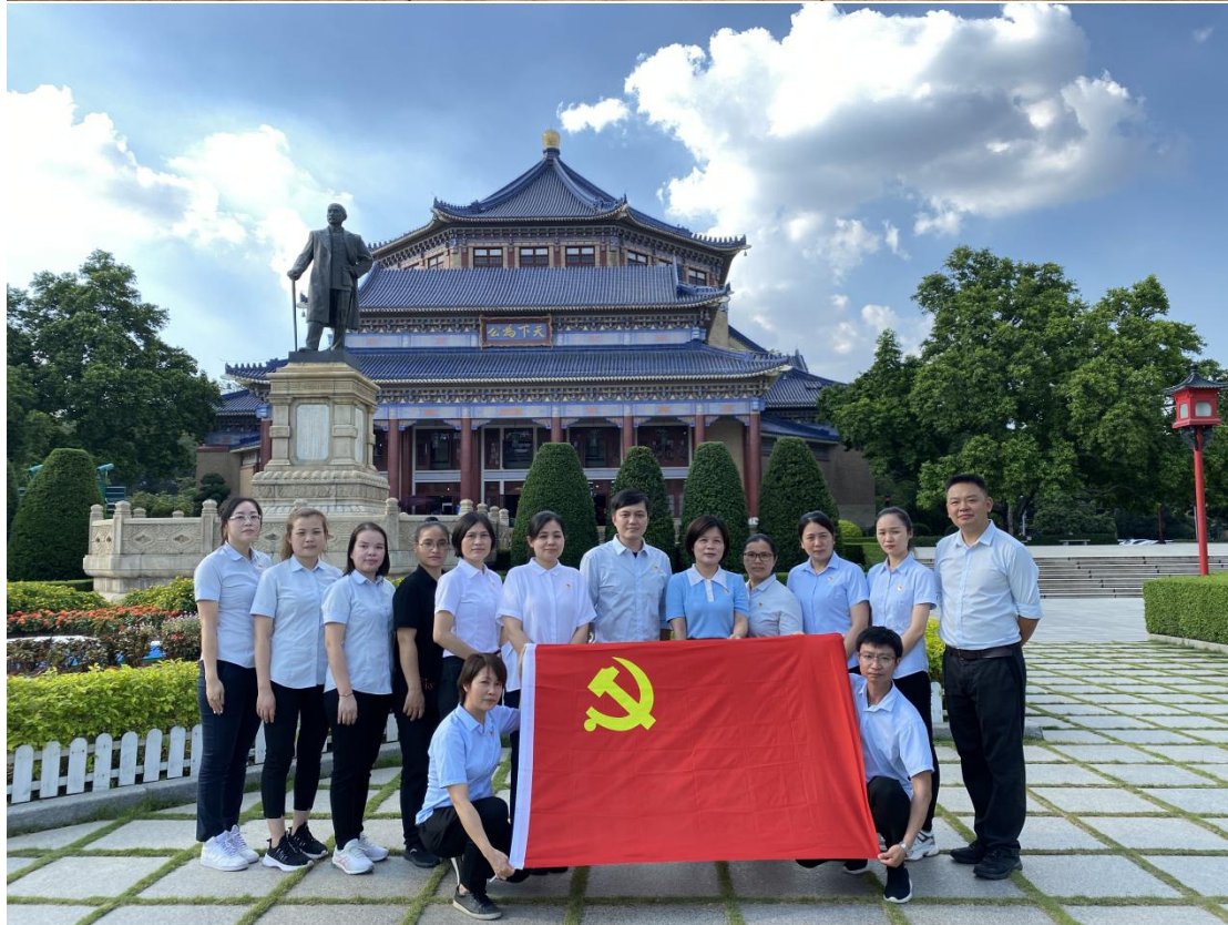
审核 | 孙晓莉、卢爱华 素材 | 集团各级党组织