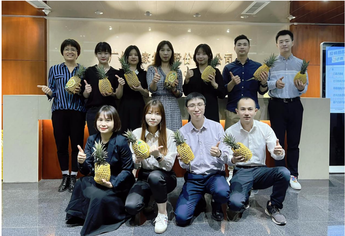
集团职工为雷州凤梨点赞

充分发挥集团的社会影响力，根据市场变化及时调整对策，创新对口帮扶工作的方式方法，着力破解农产品“难卖”问题，打通助力乡村振兴的“最后一公里”。